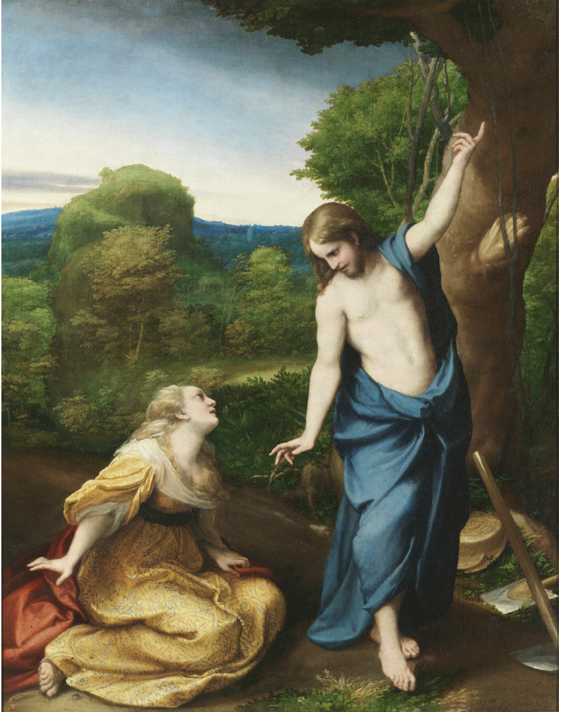
Antonio da Correggio: Noli Me Tangere [Ne tuŝu min], ĉ. 1525. Maria Magdalena kaj Kristo la matenon de la Resurekto. Maria vidas iun, supozante li estas la ĝardenisto. Ŝi finfine rekonas Jesuon. Joh 20,11-20