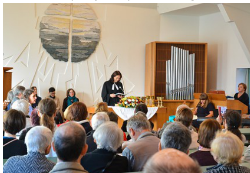
Preĝejo estis plena.