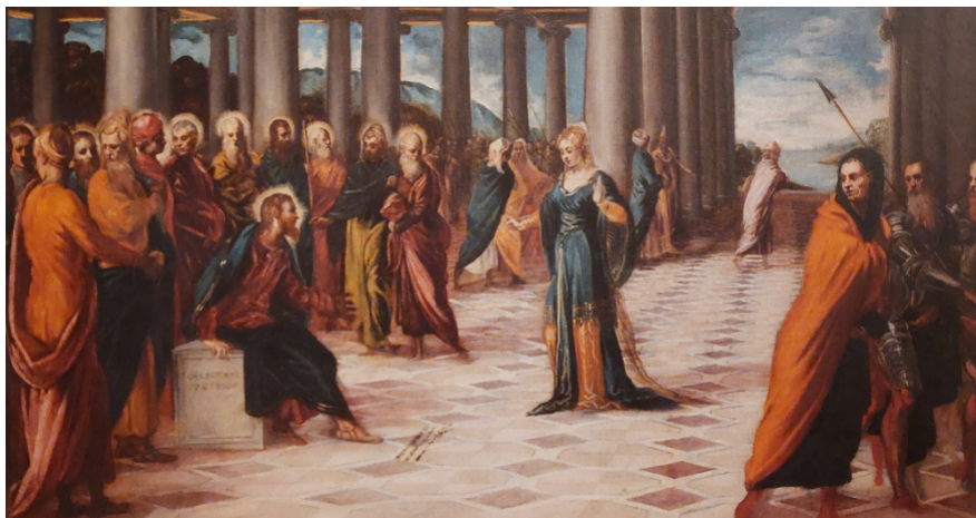
La adultino antaŭ Jesuo, El Greco ĉ. 1546

Ĉu Jesuo Kristo diris ion pri tiu ĉi afero?