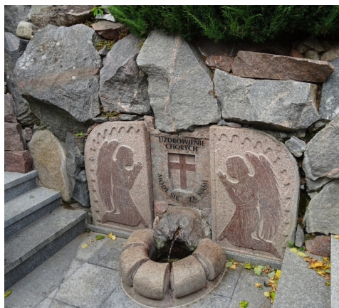
Ĉe la Sankta Akvo.