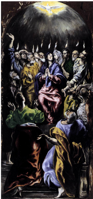
Pentekosto, El Greco ĉ 1600

Subite, la disĉiploj havis kuraĝon paroli publike. Petro eĉ predikis spontane pri la vivo, la morto kaj la releviĝo de Jesuo Kristo, lia sinjoro. Mi pensas ke la disĉiploj subite spertis grandan ĝojon. La ĝojo forpelis la timon kaj vigligis la disĉiplojn.